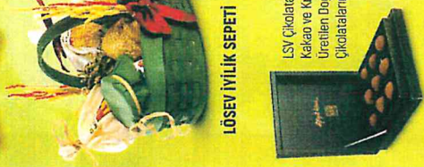
LSV Çikolata Saf Kakao ve Krema ile Üretilen Doğal Truff Çikolatamız

Hem kendinizi ve sevdiğiniz için hem de Lösemili Çocuklarınıza bağışlayabilmemiz amacıyla doğal ürünlerle, annelerimizin mutfağında hazırlanan Ramazân Sepetlerimizi hazırladık. Bu sağlıklı ürünlerden elde edilen tüm bağış ve gelirler Lösemili Çocuklarımızın tedavi ve eğitimlerine aktarılmaktadır.