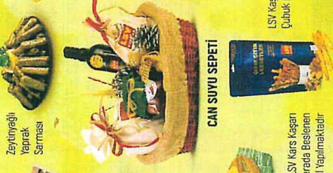
Eski LSV Karı Karısı 28 Çeşitli Otlarla Beslenen Ineklerin Sütü ile Özel Yapılmaktadır