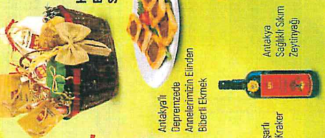
Antalyalı Depremzede Annelerimizin Elinde Böbeti Ekmeği