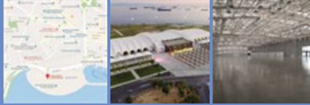
Avrasya Gösteri ve Sanat Merkezi Yenikapı - İstanbul

f carpetaistanbul i carpetaistanbul t carpetaistanbul