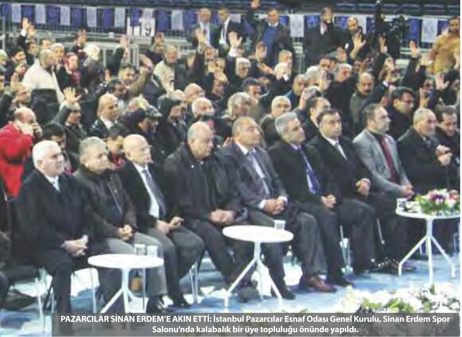
PAZARCILAR SİNAN ERDEM'E AKIN ETTİ: İstanbul Pazarcılar Esnaf Odası Genel Kurulu, Sinan Erdem Spor Salonu'nda kalabalık bir üye topluluğu önünde yapıldı.