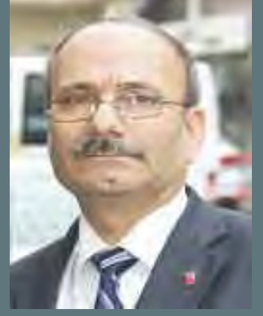
YENİBOSNA BİRLEŞİK ZEKİ BAKIR