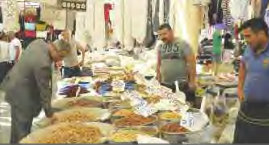
Yarar, modern Pazar yerlerine kavuşma isteğinin esnaf kadar vatandaşın talebi olduğunu vurguladı.

oluşturduğu büyük istihdamla binlerce insanımıza iş ve aş kapısı olan üyelerimizin elbette ki gelişen ve globalleşen Dünyamız çağında faaliyetini daha rahat, modern çağımızın gereğine uygun alanlar ve mekanlarda olamayışından kaynaklı olarak günümüz Semt Pazar'larımızda çok ciddi anlamda sorunlar yaşamaktadır. Pazarlar, cadde ve sokak aralarında oluşundan dolayı, bu mıntıkada oturan vatandaşlarımızın yaşadığı rahatsızlıklar bizim de hareket alanımızı kısıtlıyor."