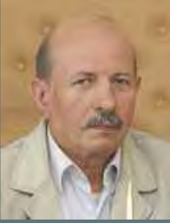
BAYRAMPAŞA BAKKALLAR MİSİM SARIŞAN