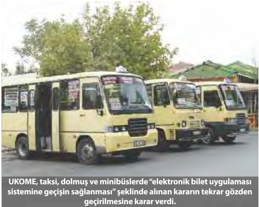
UKOME, taksi, dolmuş ve minibüslerde “elektronik bilet uygulaması sistemine geçişin sağlanması” şeklinde alınan kararın tekrar gözden geçirilmesine karar verdi.