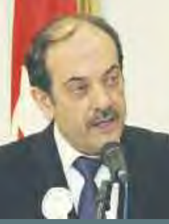
İST. MARANGOZLAR YAVUZ KARAMÜRSEL