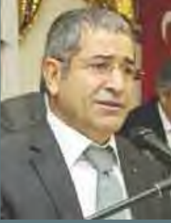
BÜYÜKÇEKMECE BİRLEŞİK RAHİMİ YAZICI