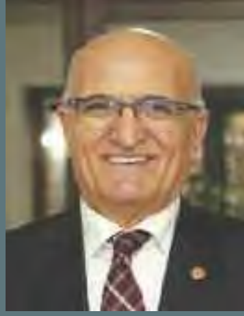
AYAKKABI SATICILARI YAŞAR HANGÜN