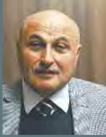
DOLAYOBA BİRLEŞİK ARSLAN METİN