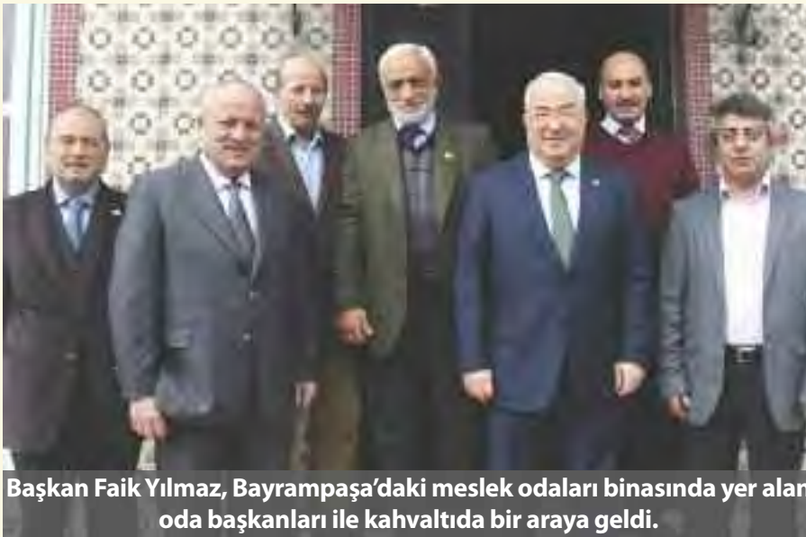
Başkan Faik Yılmaz, Bayrampaşa'daki meslek odaları binasında yer alan oda başkanları ile kahvaltıda bir araya geldi.

Sohbet havasında geçen kahvaltıda gündem yine esnaf ve Ocak ayından itibaren başlayan seçimler oldu. Başkanlar, oda seçimleri öncesi birlik mesajı verirken, seçim atmosferinin de oldukça dostane geçeceğine inandıklarını belirttiler.