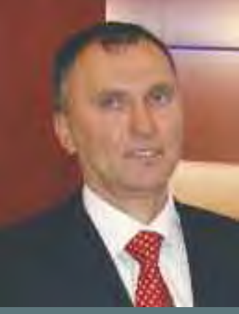
GANYAN BAYİLERİ FEVZİ KUVVET