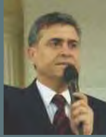
ESENLER BİRLEŞİK ŞÜKRÜ ŞAHİN