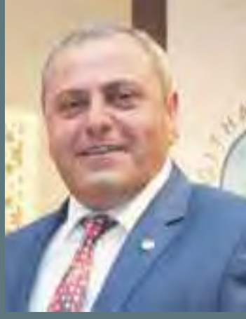
KAĞITHANE BİRLEŞİK ÖMER OSMANOĞLU