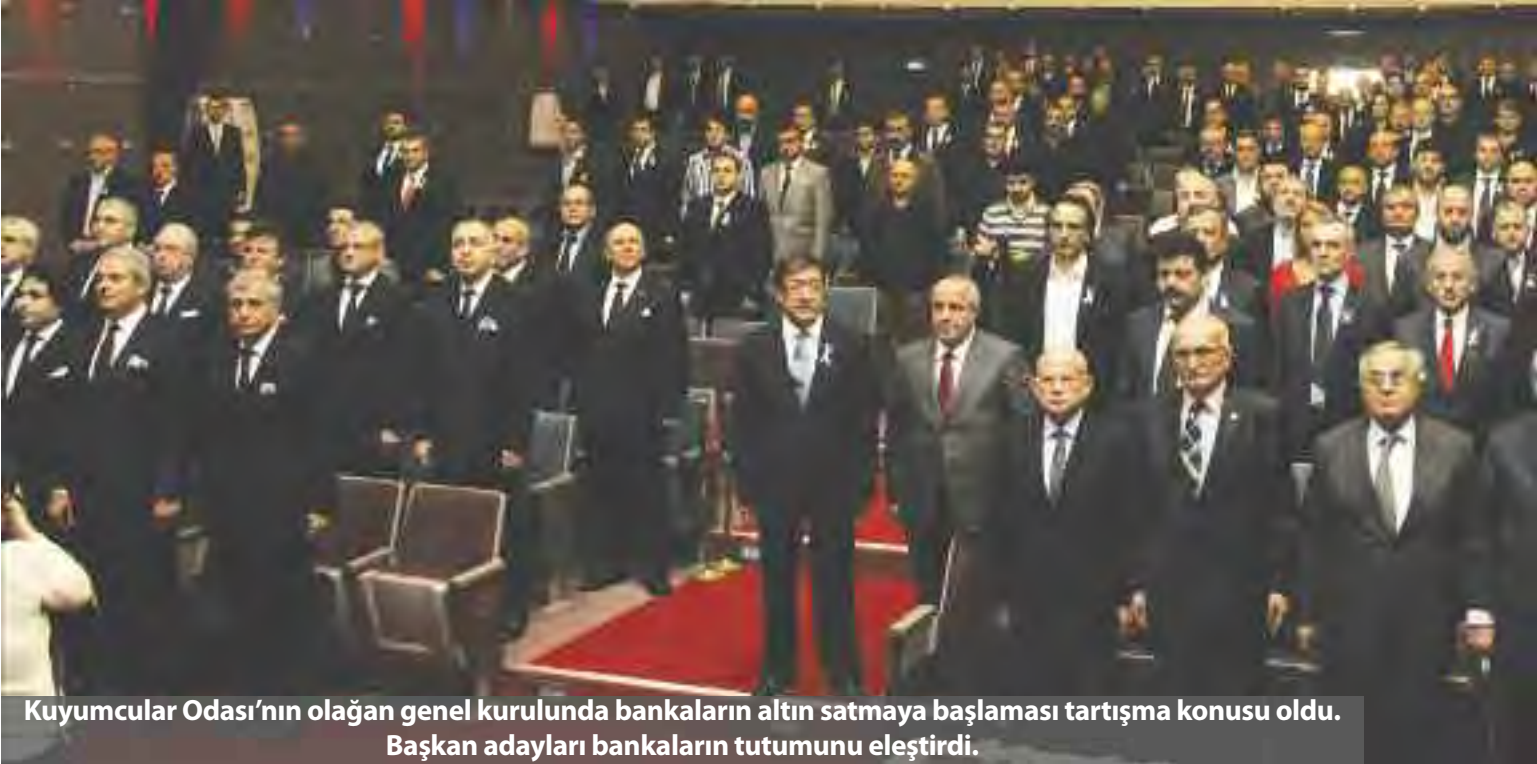
Kuyumcular Odası'nın olağan genel kurulunda bankaların altın satmaya başlaması tartışma konusu oldu. Başkan adayları bankaların tutumunu eleştirdi.