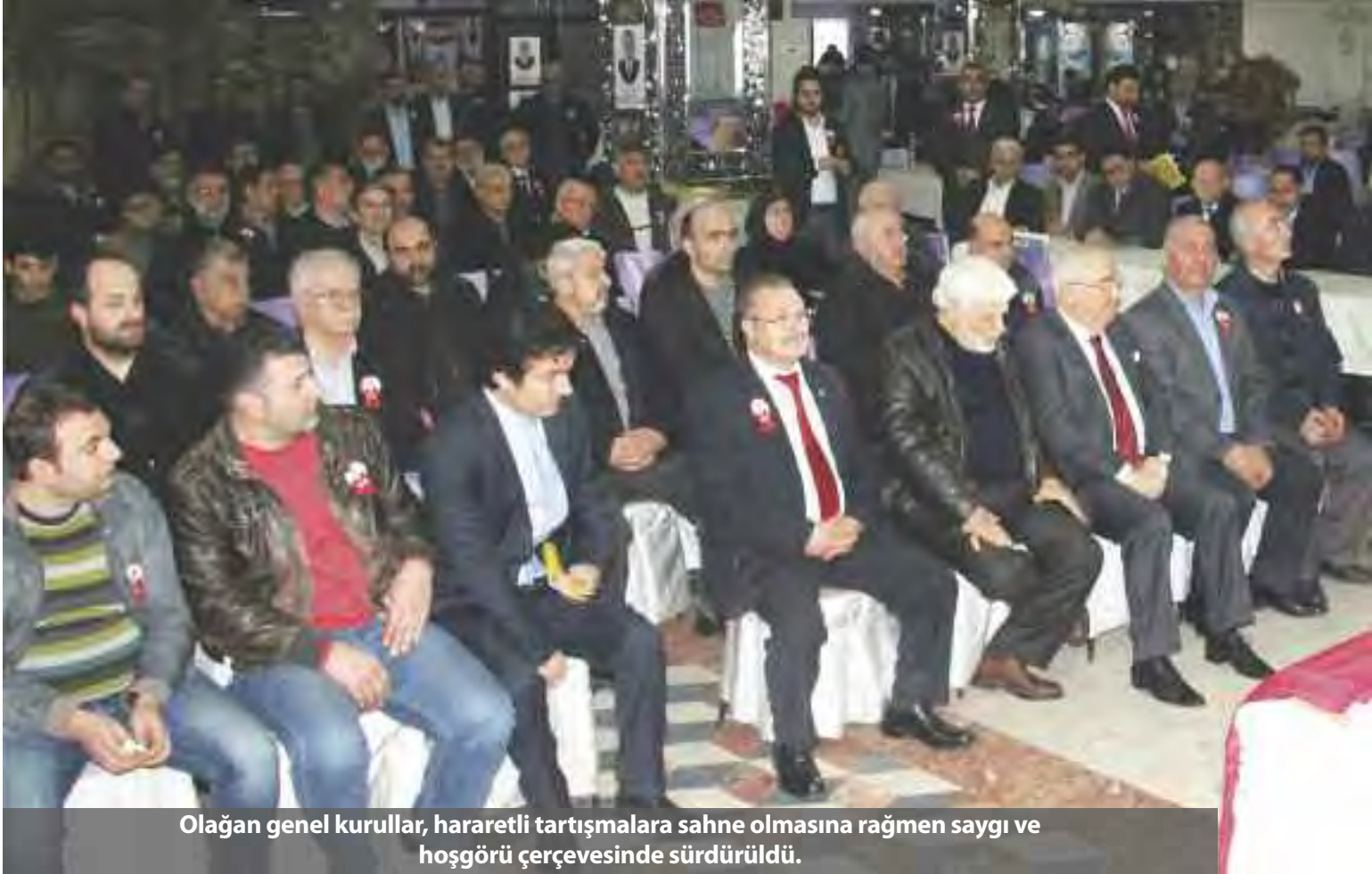
Olağan genel kurullar, hararetli tartışmalara sahne olmasına rağmen saygı ve hoşgörü çerçevesinde sürdürüldü.