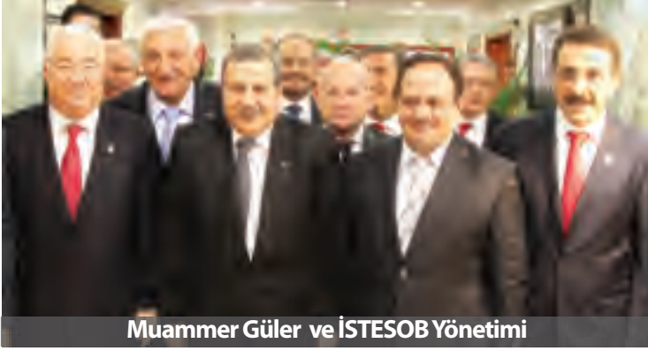
Muammer Güler ve İSTESOB Yönetimi