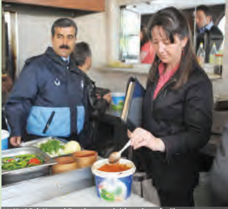
Yeni Gıda Yasası, hijyen konusunda işletmelere sıfır tolerans tanıyor.

İşyerleri dezenfektan ürünleri imalathanelerde ve laboratuvarlarında hazır tutacak. Bu temizlik gereçleri, üretim alanından ayrı bir noktada muhafaza edilecek. Personelin soyunma odaları, yatakhaneleri havalandırma sistemi, bakanlığın