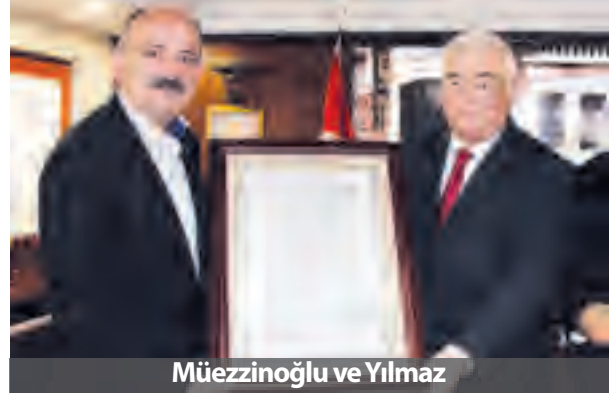
Müezzinoğlu ve Yılmaz

B aşbakan'ın kabinede 4 bakanı değiştirmesi " kan tazelemesi " şeklinde yorumlandı. İçişleri, Kültür, Turizm, Milli Eğitim ve Sağlık Bakanlıkları'na yeni isimler atandı. 4 bakanlıkta değişen isimler şöyle sıralandı;