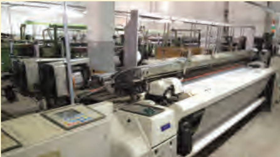
Tekstil makinelerinde KDV'nin yüzde 1'e indirilmesinin dokumacılık sektörünü şaha kaldıracığı belirtiliyor.

Türkiye'de iş istihdamının yüzde 33'nün tekstil sektörü tarafından karşılandığının bilgisini veren Olpak, tekstilcinin mutluluğunun ülke mutluluğudur diyerek, sözlerine son noktayı koydu.