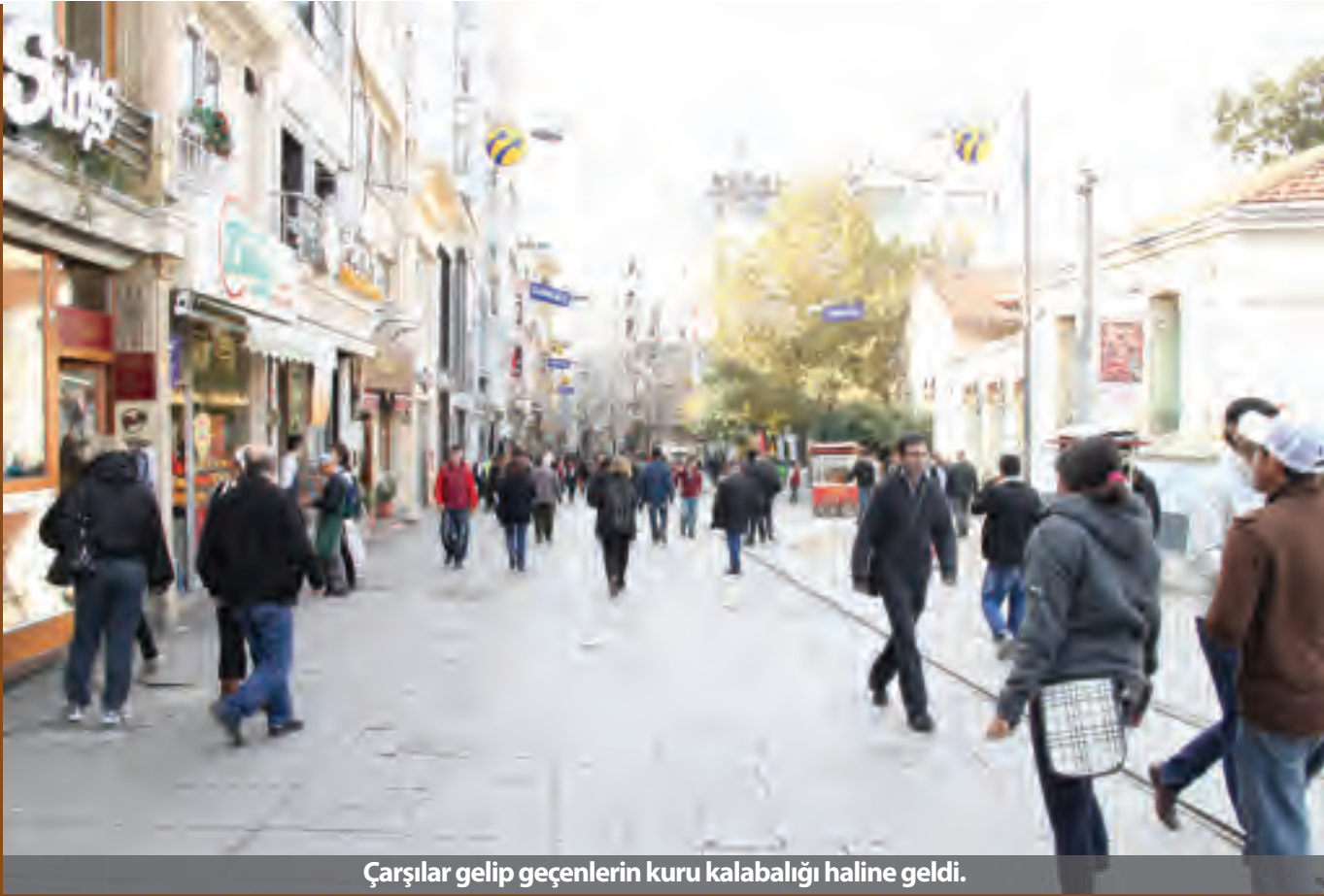
Çarşılar gelip geçenlerin kuru kalabalığı haline geldi.