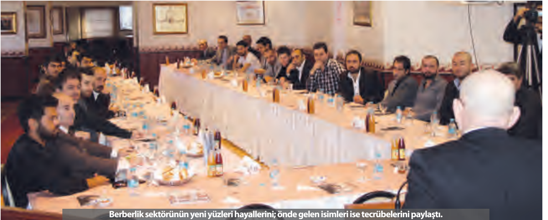
Berberlik sektörünün yeni yüzleri hayallerini; önde gelen isimleri ise tecrübelerini paylaştı.