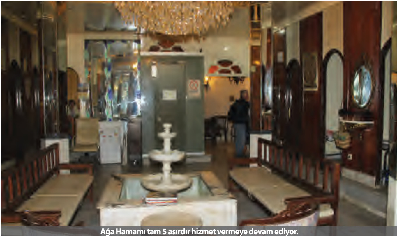
Ağa Hamamı tam 5 asırdır hizmet vermeye devam ediyor.