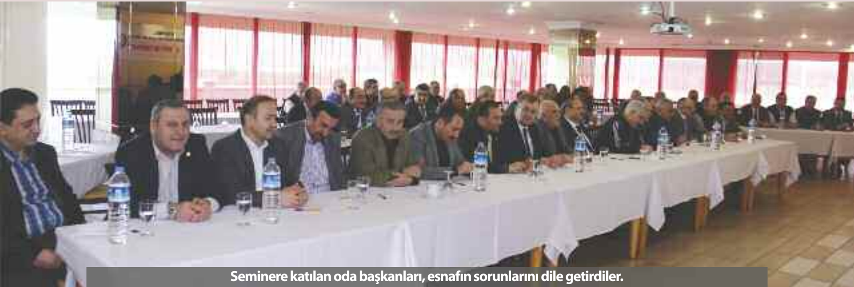
Seminere katılan oda başkanları, esnafın sorunlarını dile getirdiler.