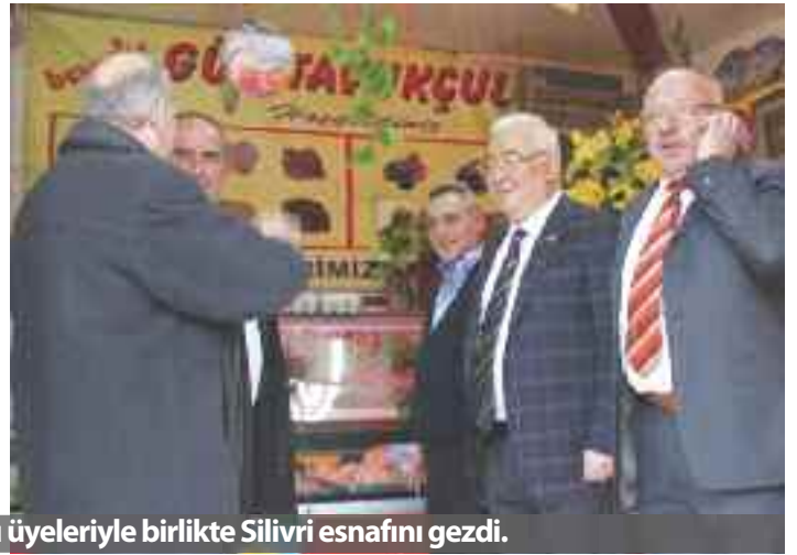
Başkan Faik Yılmaz, bazı yönetim kurulu üyeleriyle birlikte Silivri esnafını gezdi.

İstanbul Esnaf ve Sanatkarlar Odaları Birliği Başkanı Faik Yılmaz , Silivri'de, bölge esnafını ziyaret ederek sohbet etti. Esnafın sorunlarını dinleyen Yılmaz, yapılabilecekler konusunda esnafın görüşünü aldı.