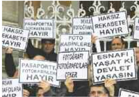
Foto kabin uygulamasına tepkili olan fotoęrafçılar, Büyük Postane'nin önünde flashlarını patlatarak, protesto gösterisinde bulundu.