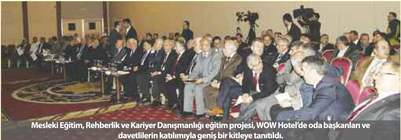
Mesleki Eğitim, Rehberlik ve Kariyer Danışmanlığı eğitim projesi, WOW Hotel'de oda başkanları ve davetlilerin katılımıyla geniş bir kitleye tanıtıldı.