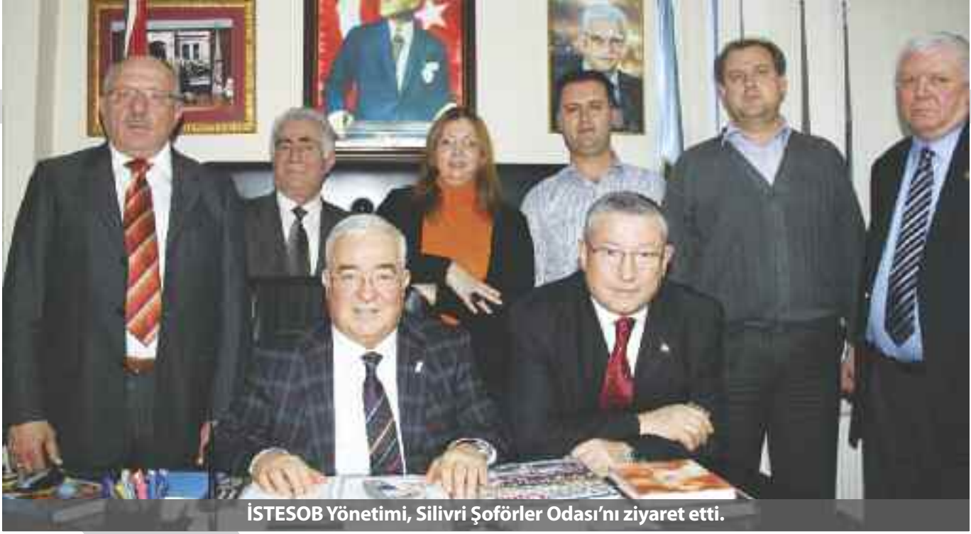
İSTESOB Yönetimi, Silivri Şoförler Odası'nı ziyaret etti.