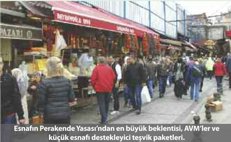
Esnafın Perakende Yasası'ndan en büyük beklentisi, AVM'ler ve küçük esnafı destekleyici teşvik paketleri.

• İndirim kampanyalarını doğru uygulamayan firmalara cezanın, tasarının şimdiki halinde sunulduğu gibi ciro üzerinden belirli bir oranla, sabit bedelle verilmesi bekleniyor. Etiket üzerinde bulunması zorunlu hale getirilmesi planlanan üretici adı ve üretim yeri yeni taslakta mecburi olmayacak.