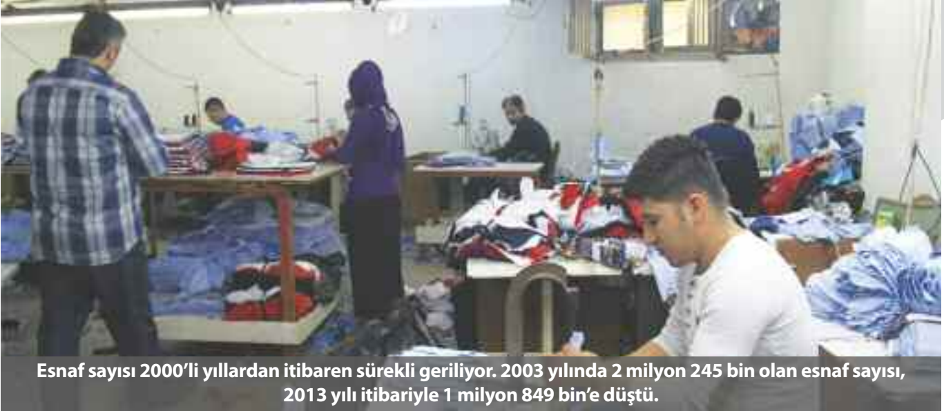
Esnaf sayısı 2000'li yıllardan itibaren sürekli geriliyor. 2003 yılında 2 milyon 245 bin olan esnaf sayısı, 2013 yılı itibariyle 1 milyon 849 bin'e düştü.

Esnafın gittikçe yok olduğu gerçeği istatistiklere de yansdı. TEPAV İstihdam İzleme Bülteni'ne göre, Türkiye genelinde esnaf sayısı bir yılda yüzde 3.4 oranında (64 bin) azalarak 1 milyon 849 bine geriledi.