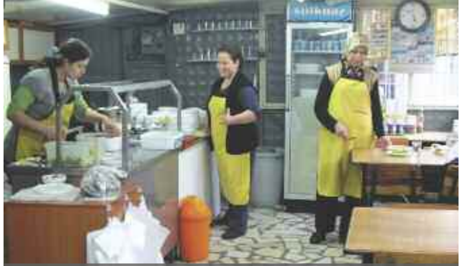
AVM'ler ve süpermarket sayısına paralel olarak esnaf sayısında düşüş yaşandığı görülüyor. İstanbul, AVM sayısı (91) bakımından Avrupa'nın bile önüne geçti.

Esnaf temsilcileri, en çok kan kaybı yaşayan iller arasında