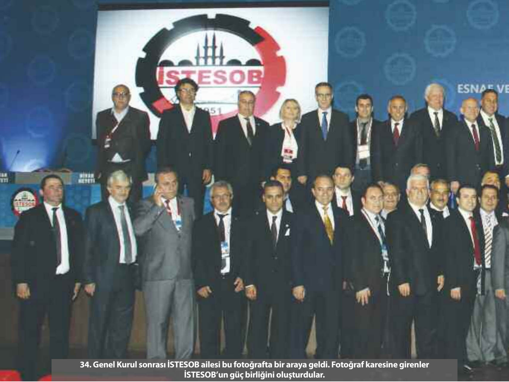
34. Genel Kurul sonrası İSTESOB ailesi bu fotoğrafta bir araya geldi. Fotoğraf karesine girenler İSTESOB'un güç birliğini oluşturdular.