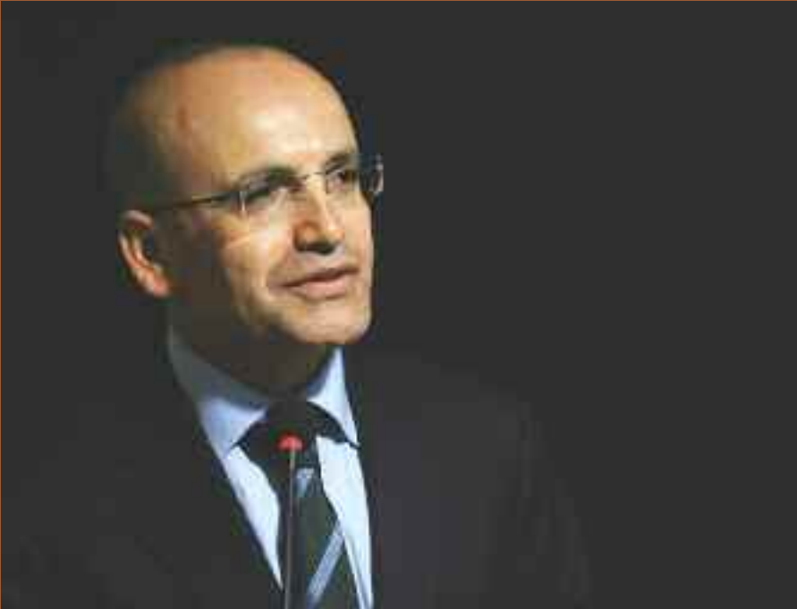
Maliye Bakanı Mehmet Şimşek, 2013 yılında 124 milyar lira KDV tahsil edildiğini, bunun 23 milyar lirasının iade edildiğini belirtti.