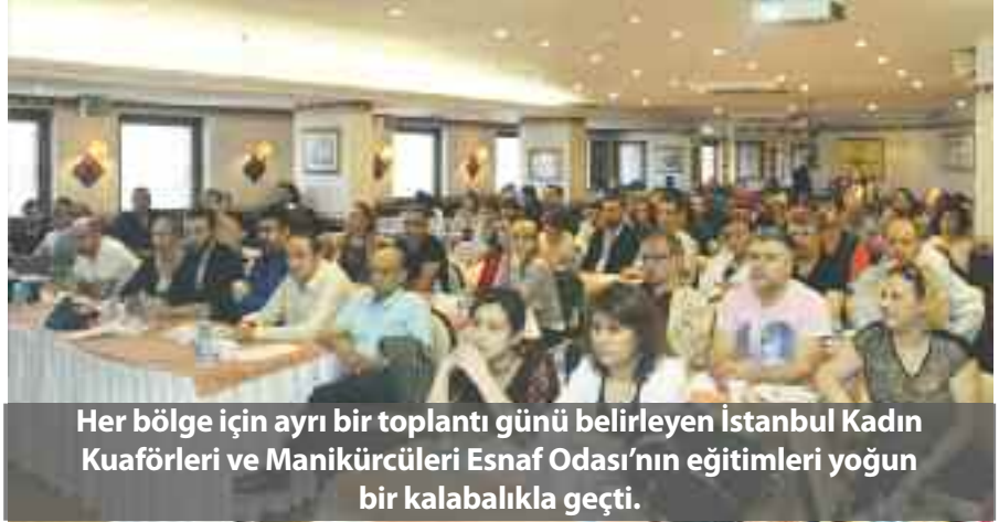
Her bölge için ayrı bir toplantı günü belirleyen İstanbul Kadın Kuaförleri ve Manikürcüleri Esnaf Odası'nın eğitimleri yoğun bir kalabalıkla geçti.

Kuaför ve güzellik salonlarında manikür-pedikür, epilasyon gibi işlerde çalışanların, hijyen konusunda yeterli donanıma sahip olmalarının toplum sağlığı açısından önemi olduğunu belirten eğitimciler uyarılarını şöyle sıraladı: "Hijyen kurallarına uyulmadığı takdirde, birçok hastalık müşteri ve çalışanlara bulaşabilmektedir. Bunların başında insan yetersizlik virüsü (HIV), Hepatit B ve