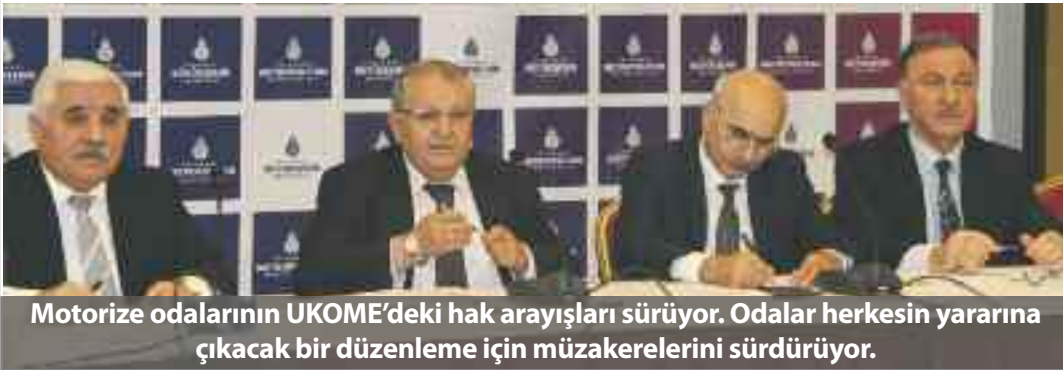
Motorize odalarının UKOME'deki hak arayışları sürüyor. Odalar herkesin yararına çıkacak bir düzenleme için müzakerelerini sürdürüyor.

Motorize oda başkanları, minibüslerin dağılımı yapılırken, adaletli davranılmasını talep etti.