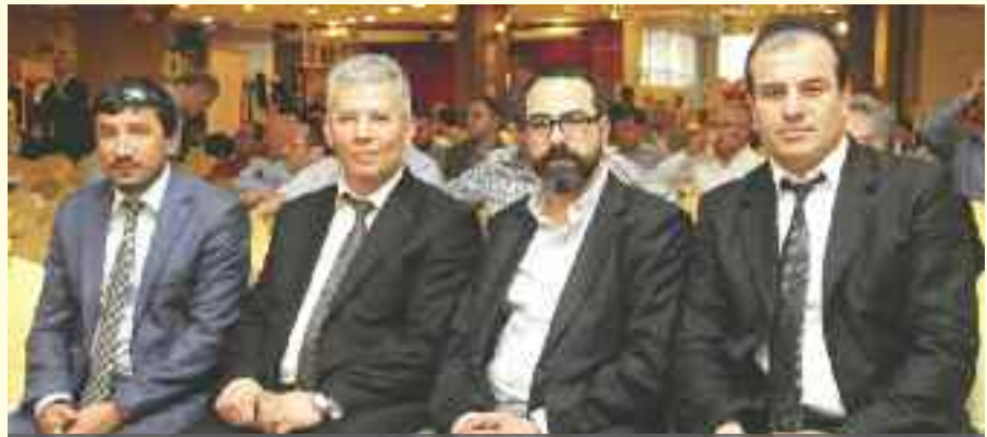
Esnaf, odanın verdiği eğitimlerden dolayı memnun olduğunu ifade etti, ayrıca yaz sezonunun düğün salonları için bereketli geçeceğini söyledi.

vurgu yapan Karasu, "Müşterileriniz artık sizin patronunuzdur. Müşteriniz varsa siz varsınız" şeklinde açıklamalarda bulundu. Digital bir çağa girildiğini belirten Karasu, eski alışkanlarından vazgeçmeyen kurumların yok olmaya mahkum olduğunu söyledi. Sosyal medyayı, önemli bir pazarlama alanı olarak gören Karasu, bu mecraları kullanmakta gecikmeyin uyarısında bulundu.