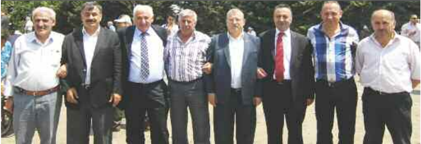
Motorize oda başkanları servisçi esnafına destek olmak için alandaki yerini aldı.

Servisçilerin sıkıntılarının çözülmesi için yetkililerin gerekeni yapmamaları durumunda izlenecek yol da mitingde dile getirildi. 9 Haziran'da piknik düzenleyecek olan servisçiler, bu tarihten sonra 10 dakika iş yavaşlatma ve işe geç gitme eylemlerini gerçekleştirecek, bir sonraki aşamada ise kontak kapatma eylemleri yapılacak. Konuşmaların bitmesinin ardından mikrofonlara konuşan servisçiler, özellikle plaka tahdidinin yapılmamasından, kesilen yüksek trafik cezalarından ve korsan yarasından sonra araçlarının bağlanmasından yakındı.