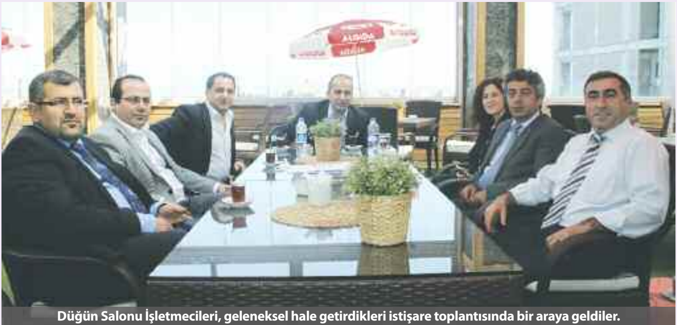
Düğün Salonu İşletmecileri, geleneksel hale getirdikleri istişare toplantısında bir araya geldiler.