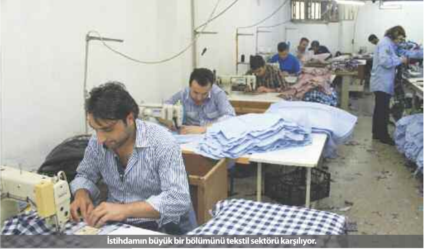
İstihdamın büyük bir bölümünü tekstil sektörü karşılıyor.