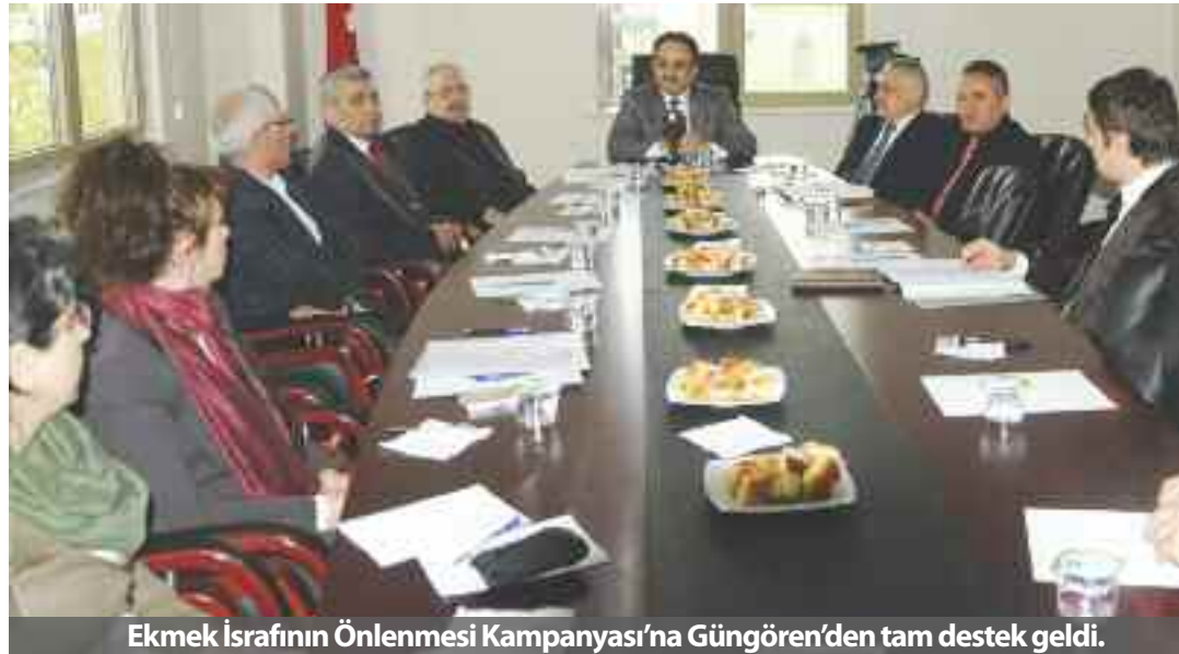
Ekmek İsrafının Önlenmesi Kampanyası'na Güngören'den tam destek geldi.

Kampanya sırasında yapılacak çalışmalar kapsamında, ilçemizde faaliyet gösteren sivil toplum kuruluşlarına bağlı işyerlerinde gerek ilgili afişlerin asılması, gerek web sitelerinde yayınlanması ve çalışanlarının bilinçlendirilmesi konularında destek vereceklerini söylediler.