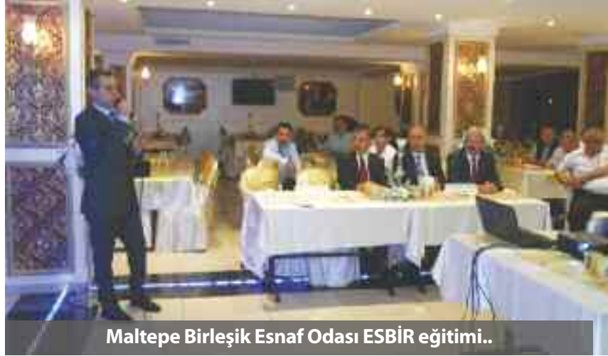
Maltepe Birleşik Esnaf Odası ESBİR eğitimi..

Sefaköy Birleşik Esnaf ve Sanatkarlar Odası 30