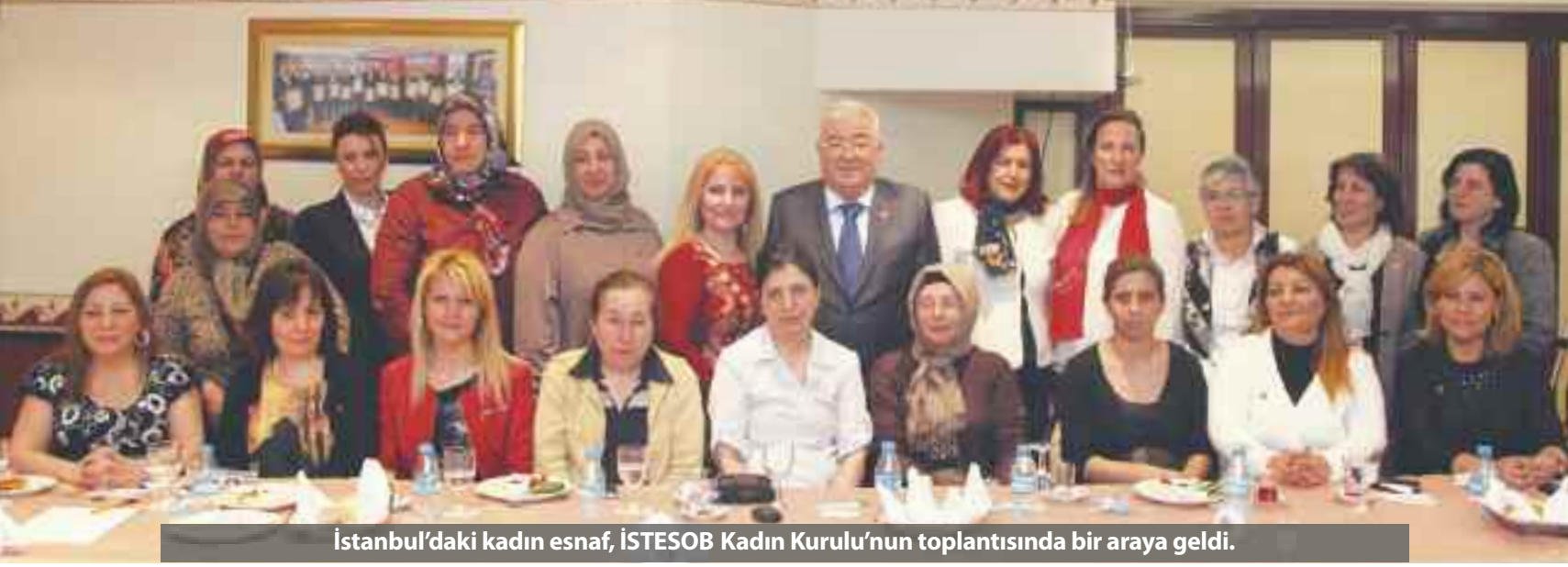
İstanbul'daki kadın esnaf, İSTESOB Kadın Kurulu'nun toplantısında bir araya geldi.