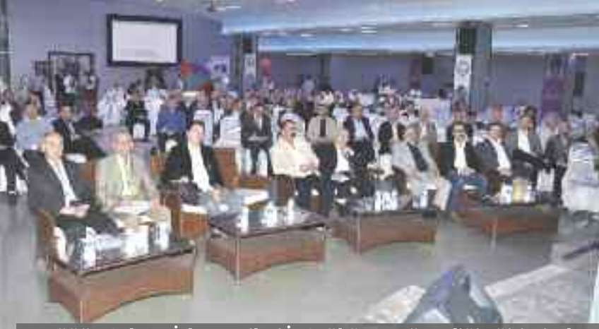
Düğün Salonu İşletmecileri İş Sağlığı ve Güvenliği eğitiminde..