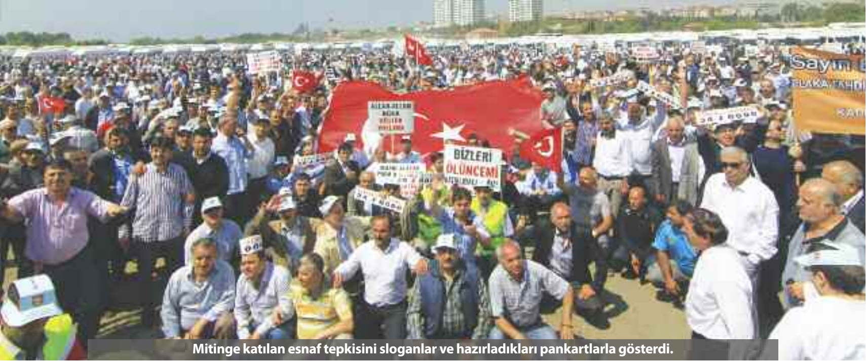
Mitinge katılan esnaf tepkisini sloganlar ve hazırladıkları pankartlarla gösterdi.

haksız uygulamaları, sigorta ve kasko ücretlerinde yapılan olağan üstü artışlar, tevkifat kanunu gibi sorunları gündeme getirdi.