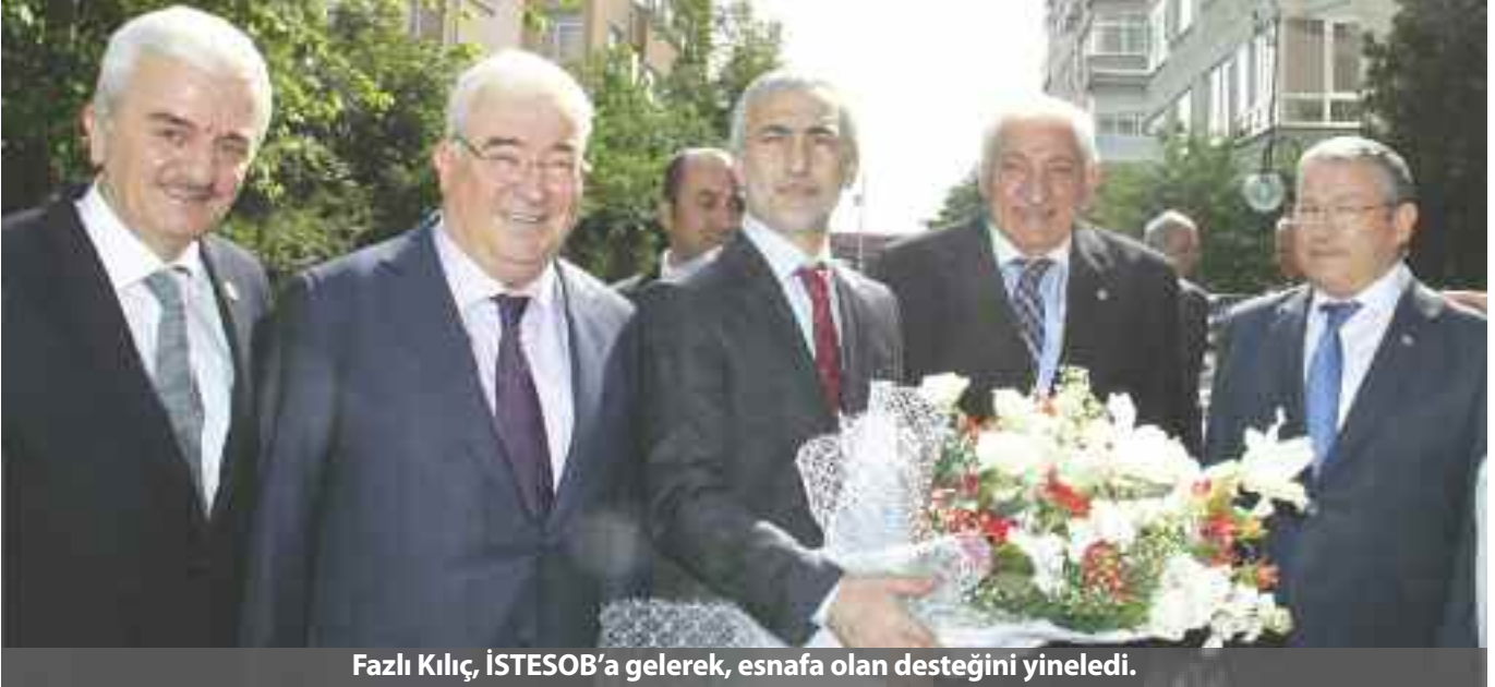
Fazlı Kılıç, İSTESOB'a gelerek, esnafa olan desteğini yineledi.

Kağıthane Belediye Başkanı Fazlı Kılıç İstanbul Esnaf ve Sanatkarlar Odaları Birliği'nde ahi sofrasının konuğu oldu. Esnaf dostu olarak bilinen Başkan Kılıç, esnaf odalarına desteğini yineledi.