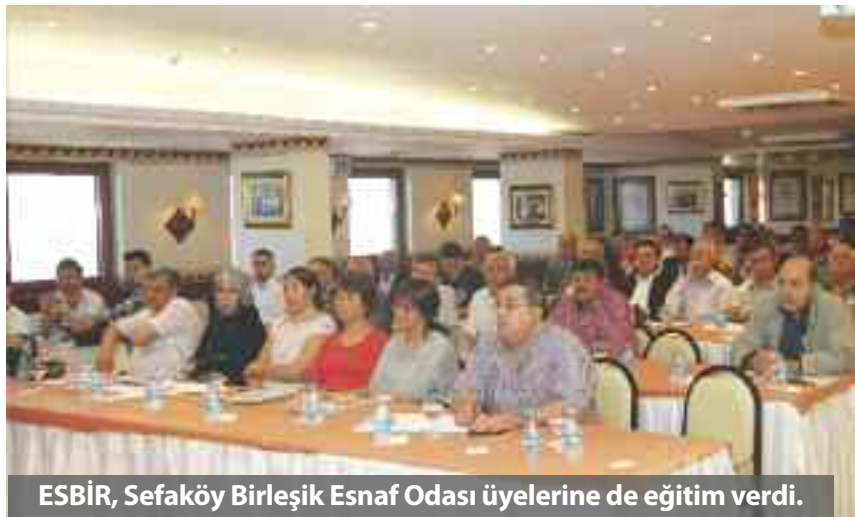
ESBİR, Sefaköy Birleşik Esnaf Odası üyelerine de eğitim verdi.