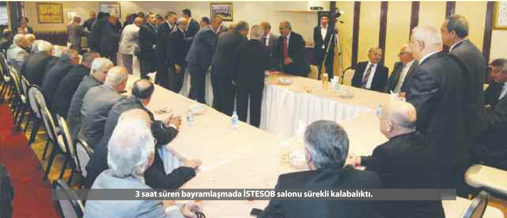
3 saat süren bayramlaşmada İSTESOB salonu sürekli kalabalıktı.

bir günde bir araya gelmesi bizi mutlu ediyor. Esnaf odaları birliği olarak da bu güzel günde yönetimdeki arkadaşlar ve oda başkanlarımızla olmak çok güzel. Esnafımıza da bayramın iyi ve güzel kazançlar getirmesini temenni ediyorum” dedi.