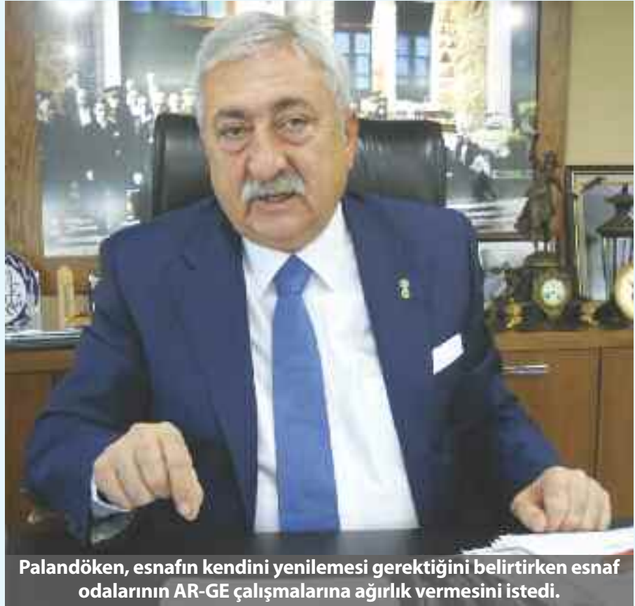
Palandöken, esnafın kendini yenilemesi gerektiğini belirtirken esnaf odalarının AR-GE çalışmalarına ağırlık vermesini istedi.

Biliyorsunuz esnaf sanatkar ülkenin can damarıdır. Türkiye genelinde en yaygın teşkilatız. Yani eğer bir kasabadaysanız, bir köydeyseniz bir meradaysanız mutlaka bir ışık var, o ışık da esnaf sanatkarıdır. Dolayısıyla bu kadar büyük bir kesimin bu kadar önemli bir kesimin problemleri de tabii ki olacak. Esnaf sanatkar dünyada yaşanan değişim ve dönüşüme ayak uyduramadığı için zora girdi. Bir taraftan esnaf sanatkar, değişimi dükkanında tezgahında uygulayamadığı gibi sermaye erozyonuna da girdi. 1980’lerin