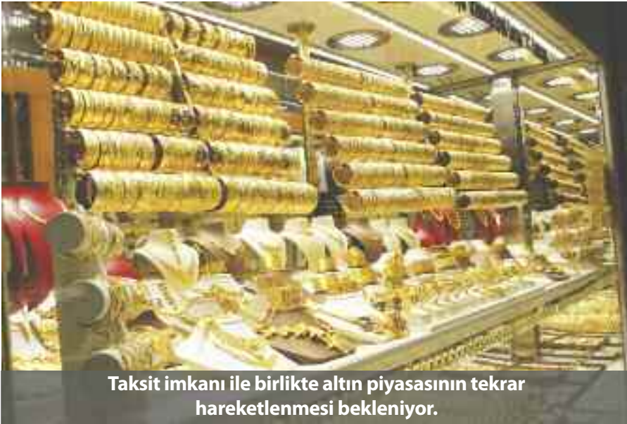
Taksit imkanı ile birlikte altın piyasasının tekrar hareketlenmesi bekleniyor.

Bankacılık Düzenleme ve Denetleme Kurumu (BDDK), kredi kartlarıyla gerçekleştirilecek kuyumcularla ilgili satışlarda taksit uygulanamayacağına yönelik mevzuat hükmünü kaldırdı.