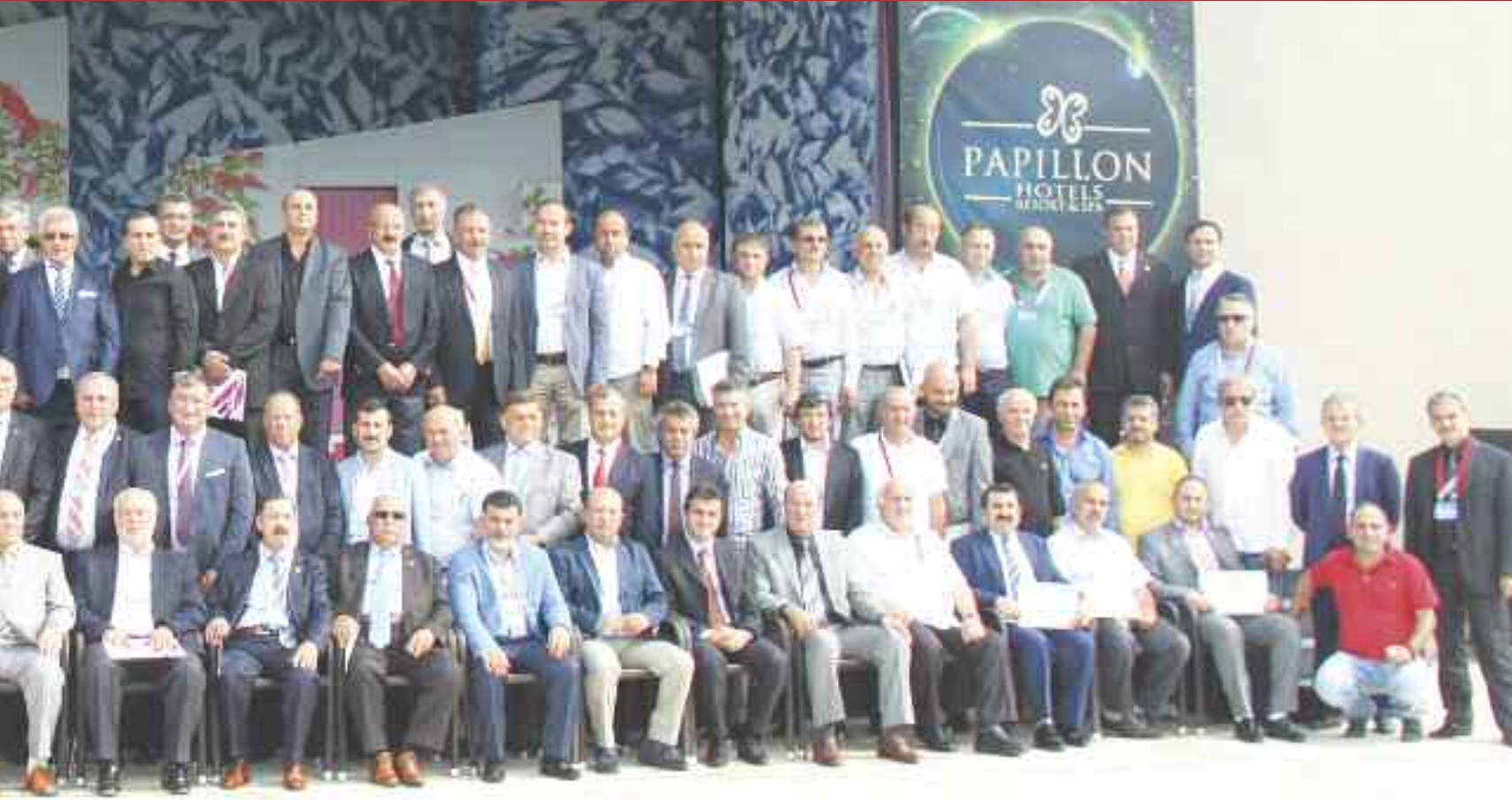
Seminer sonrası, tüm oda başkanları ve yöneticileri toplu fotoğrafta bir araya geldi.

eden Yılmaz, esnaf sanatkârın sorunları hakkında genel bir çerçeve çizdi ve olası sorunlara ışık tuttu. Çözüm önerilerini de sıralayan Yılmaz, esnafın sorunlarını dile getirilmesi