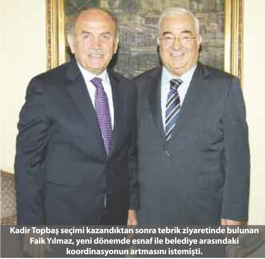
Kadir Topbaş seçimi kazandıktan sonra tebrik ziyaretinde bulunan Faik Yılmaz, yeni dönemde esnaf ile belediye arasındaki koordinasyonun artmasını istemişti.

İstanbul Büyükşehir Belediyesi Başkanı Kadir Topbaş'ın 3'üncü kez başkanlık koltuğuna oturmasının ardından, İstanbul'un Stratejik Planı açıklandı. Planlar içinde esnafı yakından ilgilendiren projeler de yer alıyor.