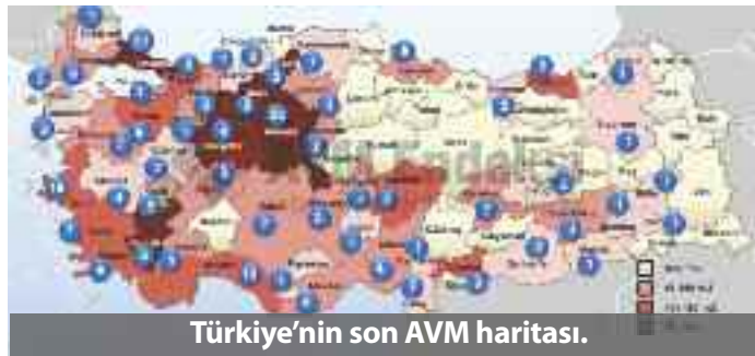
Türkiye'nin son AVM haritası.

"AVM Potansiyel Analiz Raporuna" göre, bu yılın ilk dokuz ayında AVM sayısı 342'ye, kiralanan alan ise 9.96 milyon metrekareye yükseldi. Türkiye genelinde bu yıl açılması beklenen 64 alışveriş merkezinden (AVM) yatırım iptalleri ya da ertelemeler nedeniyle sadece 16'sı hayata geçerken; toplam AVM sayısı Eylül sonu itibariyle 342'ye ulaştı. Eva Gayrimenkul Değerleme ile Akademetre tarafından hazırlanan "AVM Potansiyel Analiz Raporuna" göre, 2013 tamamında 326 AVM toplam 9.25 milyon metrekare kiralanan alan ile faaliyet gösterirken; bu yılın ilk