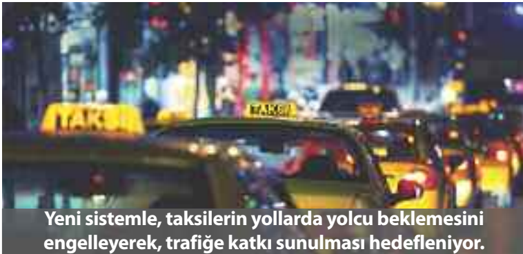
Yeni sistemle, taksilerin yollarda yolcu beklemesini engelleyerek, trafiğe katkı sunulması hedefleniyor.

Sistem Amerika ve Türkiye dışında Meksika, Kanada, İngiltere, Polonya ve İrlanda'da da 20'den fazla şehirde kullanılıyor.