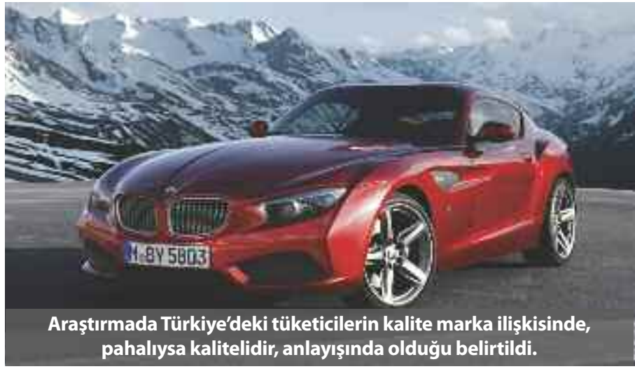
Araştırmada Türkiye'deki tüketicilerin kalite marka ilişkisinde, pahalıysa kalitelidir, anlayışında olduğu belirtildi.

İsviçre kuruluşu olan Uluslararası Onaylama Derneği GmbH – ICERTIAS'ın Zürih'te bulunan merkez bürosu tarafından, Mayıs Ayı'nda Türkiye'de yürütülen ilk Türk QUDAL – Quality meDAL – DEEPMA Araştırması 'nın sonuçları açıklandı. Türkiye'nin bütün bölgelerini kapsayarak gerçekleştirilen araştırma, internet anketi yoluyla Mayıs 2014'te 15 yaş üzeri internet kullanıcısı olan 1.200 Türk vatandaşının katılımıyla gerçekleştirildi. Türkiye için ilk kez gerçekleştirilen ve 100'den fazla ticari ve ticari olmayan kategoriye (örn. en kaliteli süt, en kaliteli araba, en kaliteli yerel şarkıcı) kapsayan QUDAL Araştırması, 2011 yılından beri Avrupa, Asya, Amerika kıtalarındaki ülkelerde yapılıyor. Araştırmada DEEPMA yönteminin kullanılması ile de benzer