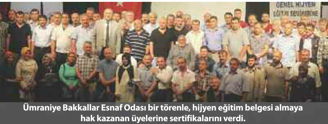
Ümraniye Bakkallar Esnaf Odası bir törenle, hijyen eğitim belgesi almaya hak kazanan üyelerine sertifikalarını verdi.