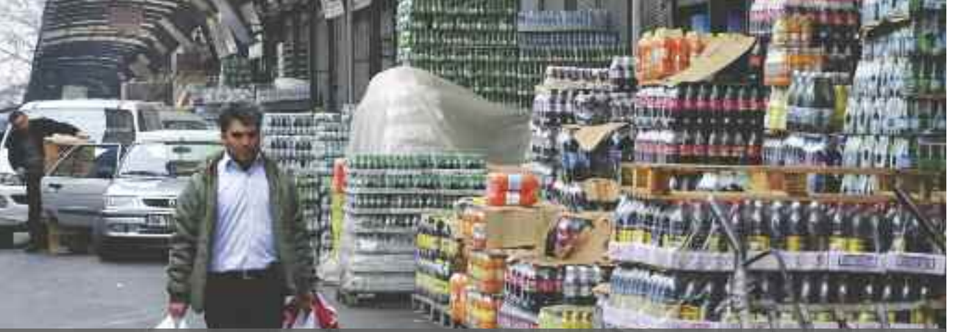
AVM-küçük esnaf savaşında, esnaf devlet kadar vatandaşın da desteğini bekliyor.