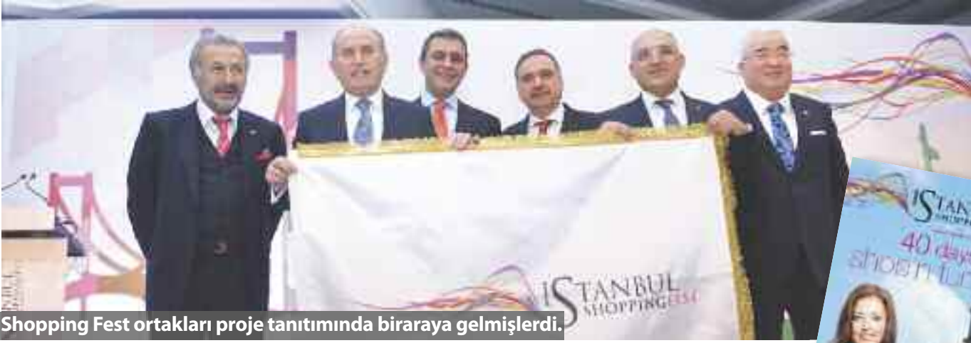
Shopping Fest ortakları proje tanıtımında biraraya gelmişlerdi.