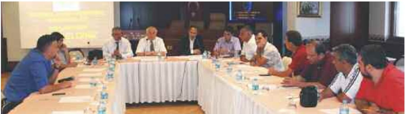
Türkiye’deki diş teknisyenleri odaları, Diş Teknisyenleri Dernekleri Federasyonu çatısı altında bir araya geldi.