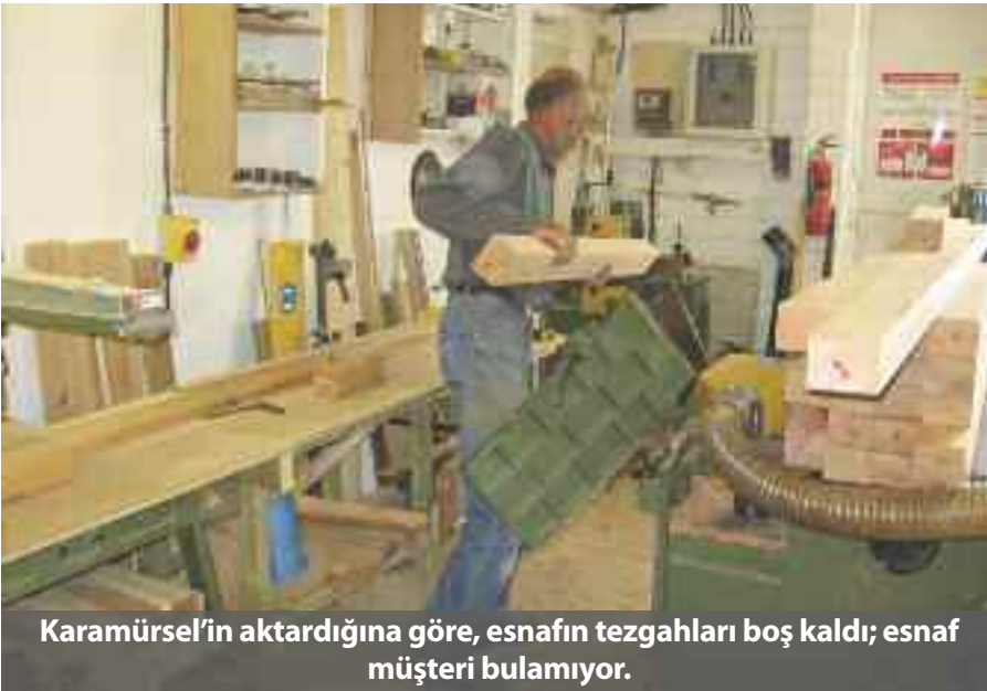
Karamürsel'in aktardığına göre, esnafın tezgahları boş kaldı; esnaf müşteri bulamıyor.

Karamürsel, yeni eleman yetişmemesi konusunu da ele aldı. Kimsenin çocuğunu, kir pas içinde olacağı bir meslekte çalıştırmak istemediğini belirten Karamürsel, "Bırakın aileleri, endüstri meslek lisesi ağaç işleri bölümü veya meslek yüksek okulu ağaç dekorasyon bölümü mezunları bile sektöre girmiyor" şeklinde konuştu.