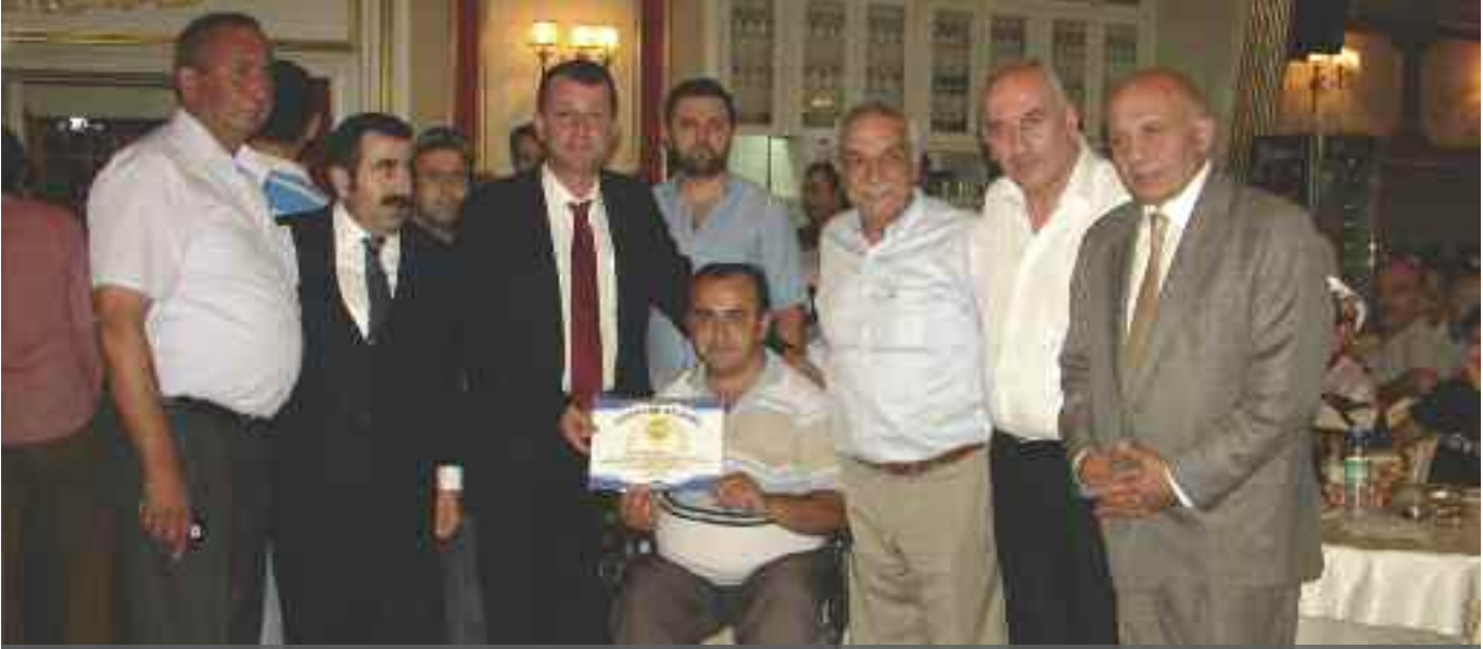
Daha önce hijyen belgesi almayı hak kazanmış esnafa sertifikaları iftar yemeğinde dağıtıldı.