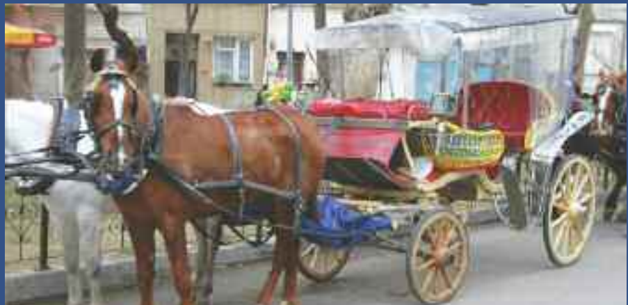
Adanın sembolü olan faytoncular yaşam savaşı veriyor.

1.5 senedir istedikleri tarifeleri alamadıkları şikayetçi olan oda yönetimi, ruhsat yenileme konusunda da kendilerine problemler çıkartıldığını ifade etti. Yazın sadece 3 ay çalıştıklarını, 9 ay boş aracı beklediklerini söyleyen oda yönetimi, müşterilerinin çoğunun Arap turistlerden oluştuğunu belirtti.