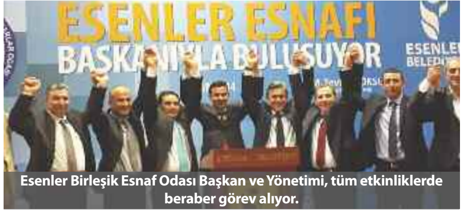
Esenler Birleşik Esnaf Odası Başkan ve Yönetimi, tüm etkinliklerde beraber görev alıyor.

Esenler Birleşik Esnaf ve Sanatkarlar Odası, Esenler Meydanı'nda her gün farklı bir esnaf standı açtı. Esnafı halkı kaynaştırmak için böyle bir organizasyona imza attıklarını belirten Şahin, esnafın da gün boyunca vatandaşa ücretsiz hizmet verdiğini kaydetti. Berberinden,