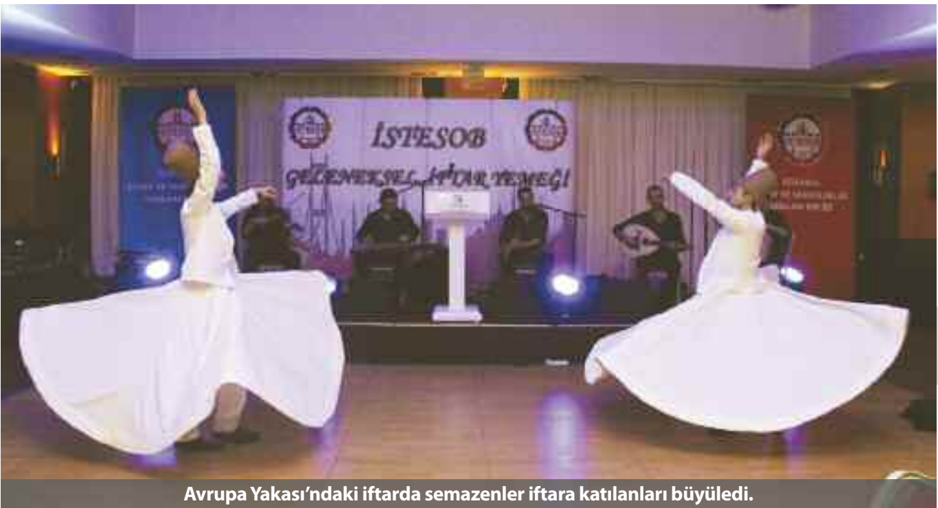
Avrupa Yakası'ndaki iftarda semazenler iftara katılanları büyüledi.