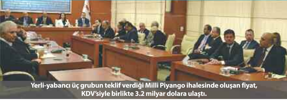
Yerli-yabancı üç grubun teklif verdiği Milli Piyango ihalesinde oluşan fiyat, KDV'siyle birlikte 3.2 milyar dolara ulaştı.