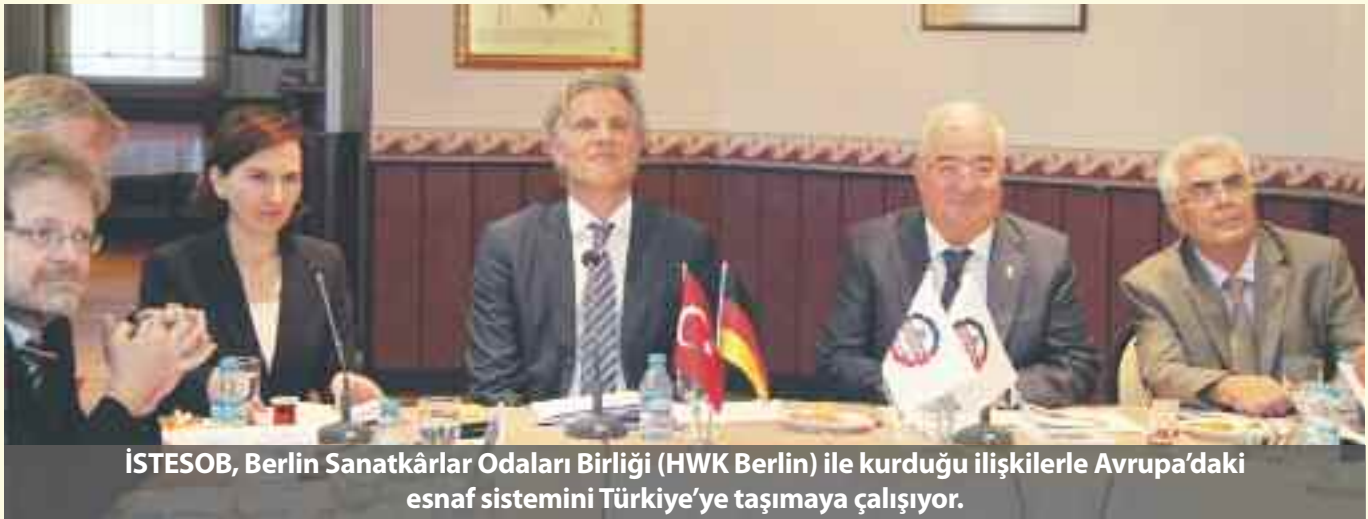
İSTESOB, Berlin Sanatkarlar Odaları Birliği (HWK Berlin) ile kurduğu ilişkilerle Avrupa'daki esnaf sistemini Türkiye'ye taşımaya çalışıyor.