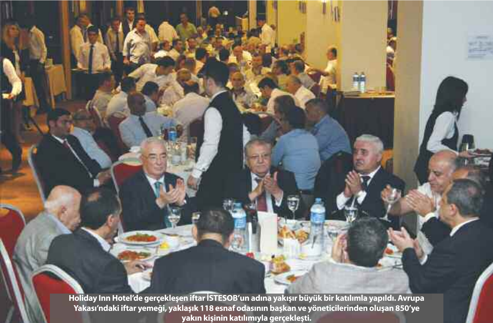
Holiday Inn Hotel'de gerçekleşen iftar İSTESOB'un adına yakışır büyük bir katılımı yapıldı. Avrupa Yakası'ndaki iftar yemeği, yaklaşık 118 esnaf odasının başkan ve yöneticilerinden oluşan 850'ye yakın kişinin katılımıyla gerçekleşti.

Rahmet, bereket ve mağrifet ayı olan Ramazan'da, esnaf dostlarıyla birlikte olmaktan son derece mutlu olduğunu ifade