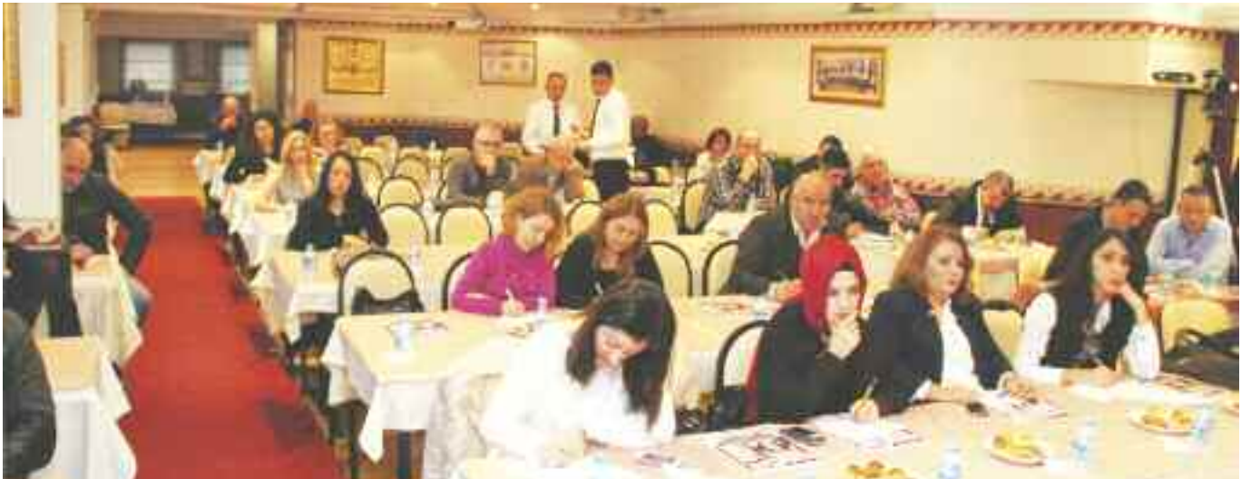
Oda genel sekreterleri iki gruba ayırdı ve seminer iki gün boyunca İSTESOB'da gerçekleşti.

devredilecek malzeme, birim personeli ile arşiv yetkili personeli tarafından uygunluk kontrolünden geçirilir."