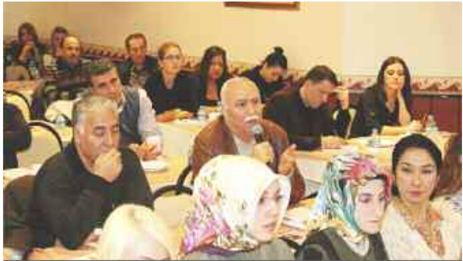
Genel sekreterler merak edilen soruları divana yöneltti ve fikir alışverişinde bulundu.

Garip, arşivleme konusu için de şunları söyledi. "Her yılın ocak ayı içinde, önceki yıla ait