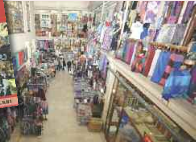
İSTESOB 2011'de yaptığı Çin Kitapçığı çalışmasıyla Çin'den gelen ürünlere dikkat çekmişti.