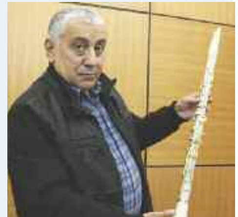
Özdemir'in yapımında uzun yıllar emek harcadığı klarnetine fiyat biçilmekte zorlanılıyor.

eşyası olsun diye satmam. İsterim ki devletim bunu alsın ve müzede sergilensin.”