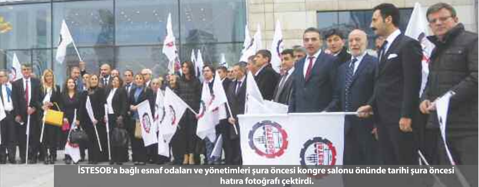
İSTESOB'a bağlı esnaf odaları ve yönetimleri şura öncesi kongre salonu önünde tarihi şura öncesi hatıra fotoğrafı çekti.