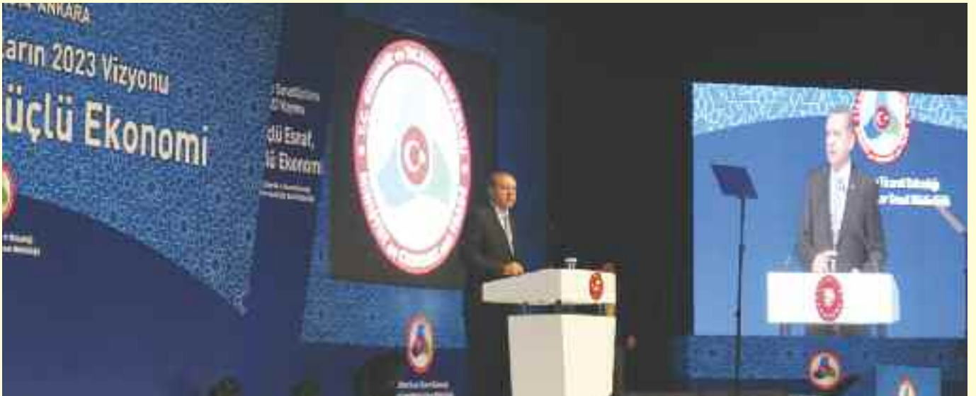
Cumhurbaşkanı Erdoğan, esnafın milletin omurgası olduğunu söylerken, esnafa destek vermeye devam edeceklerini ifade etti.

Cumhurbaşkanı Erdoğan, esnaf, sanatkarların kredi faizinin 2002 yılında yüzde 47 iken, bugün yüzde