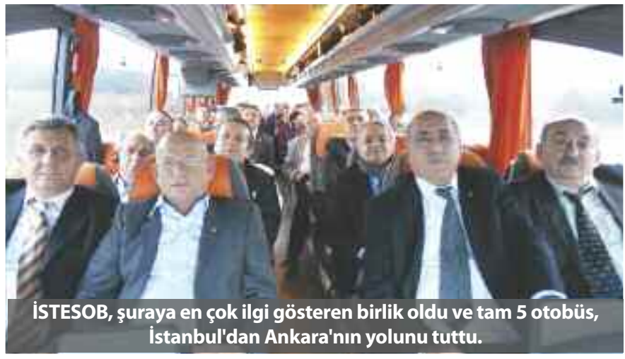
İSTESOB, şuraya en çok ilgi gösteren birlik oldu ve tam 5 otobüs, İstanbul'dan Ankara'nın yolunu tuttu.