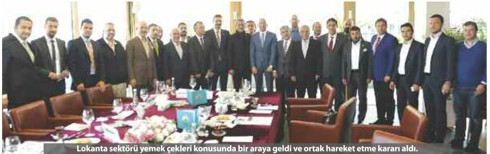
Lokanta sektörü yemek çekleri konusunda bir araya geldi ve ortak hareket etme kararı aldı.

* Sistemde kullanılan POS cihazlarına uygulanan sigorta bedelleri ve bakımı için istenen ücret yüksek.