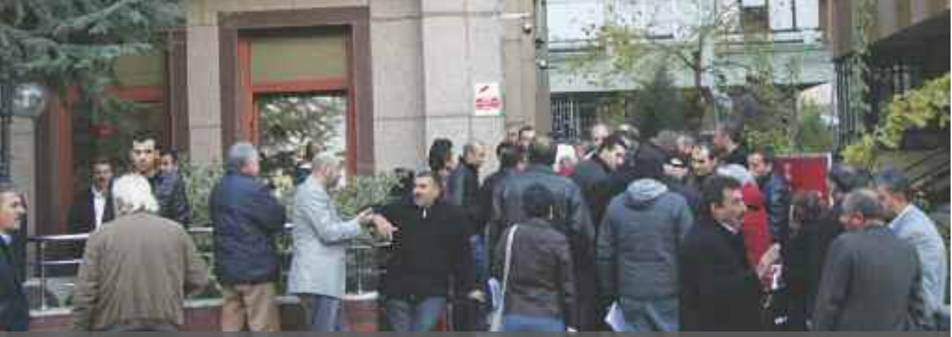
Odaların yıl içindeki denetimleri Sicil Müdürlüğü'nde de yoğunluk yaşattı. Yeni kayıtlar yıl boyunca sürdü.