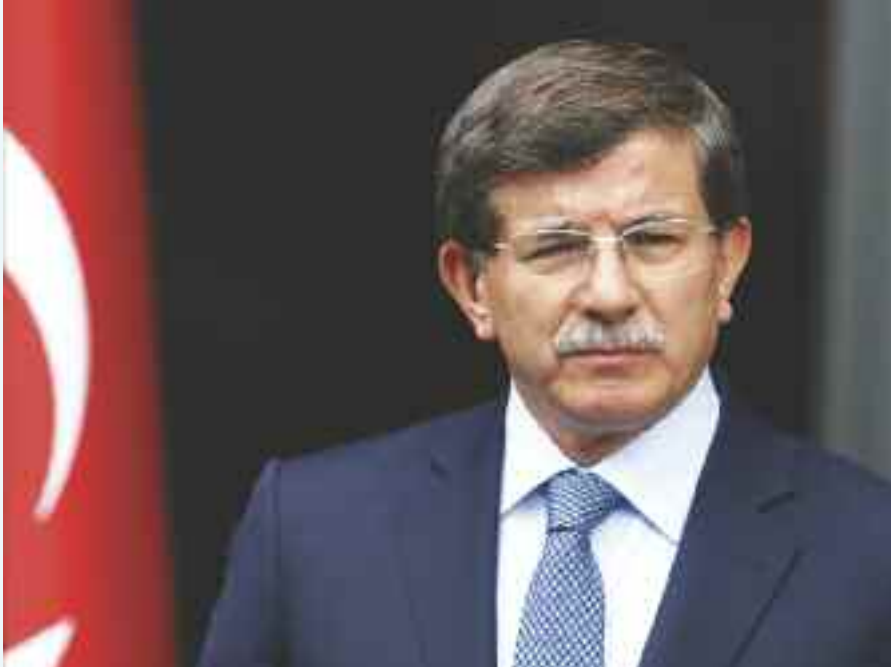
Ahmet Davutoğlu, yeni iş sağlığı paketini açıklarken, en önemli değişikliğin zihinde başlaması gerektiğini söyledi.

Ardı ardına yaşanan maden faciaları ve iş kazaları sonrası hükümet, yeni iş sağlığı ve güvenliği tasarısını gündemine aldı. Tasarıda zorunluluklar ve cezai işlemler artırılıyor. Esnafa ise kolaylık sağlanacağı açıklandı.